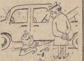
— A może nie ma benzyny?

W 310 dzień roku słońce wzeszło o godz. 6.40, zajdzie zaś o godz. 15.59. Imieniny obchodzą Leonard, Feliks, Wszechwład Dziurny synoptyk przewiduje dla Łodzi i województwa łódzkiego następującą pogodę: Zachmurzenie niewielkie, w ciągu dnia duże, w godzinach popołudniowych możliwe przelotne opady deszczu. W nocy przymroki. Temperatura maksymalna ok. 10 stopni C. Wiatry umiarkowane, miejscami dość silne południowe i pod-zach. Jutro przejściowe opady deszczu. Temperatura bez większych zmian. (Wczoraj o 21 ciśnienie wynosiło 746,8 mm). Ważniejsze rocznice 1893 — Zmarł Piotr Czajkowski kompozytor rosyjski 1918 — W Lublinie powstał Tymczasowy Rząd Ludowy Republiki Polskiej powołany przez I. Daszyńskiego 1923 — W Krakowie wybuchło powstanie robotników 1888 — Ur. się Marcin Kasprzak pionier medycyny społecznej 1939 — Aresztowanie przez gestapo profesorów Uniwersytetu Jagiellońskiego Taka sobie myśl Mieć świadomość tego, że się plonie, to stagnać. Uśmiechnij się