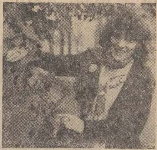
CAF — Szyperko