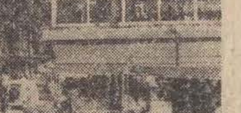
Katona jest największym hiszpańskim miastem portowym nad Oceanem Atlantyckim. Założone przez Fenicjan w 1100 r. pne., od trzech tysięcy lat swojej historii nieodmiennie jest bardzo ważnym portem handlowym Półwyspu Iberyjskiego. N/z: fragment miasta.

Na zaproszenie ministra spraw zagranicznych Rumunii, Georgea Macovescu z oficjalną wizytą do Bukaresztu przybył minister spraw zagranicznych Izraela, Aba Eban.