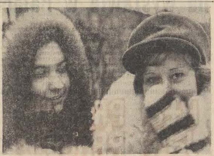
Kto się boi zimy, ten się boi. My nie!...