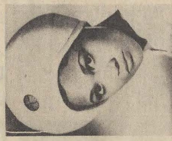
Kadr z filmu "2001: Odyseja kosmiczna"