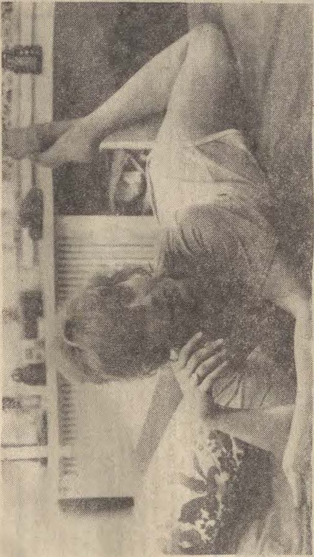
Kadr z filmu "Godzina szeptu"