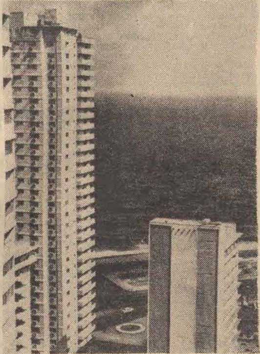
Stolica Kuby - Hawana. W lok na zaskok od strony bulwaru Malekon.

Na zaproszenie I sekretarza KC Komunistycznej Partii Kuby, premiera Rządu Rewolucyjnego, Fidela Castro odleciał w poniedziałek rano na Kubę z oficjalną wizytą przyjaźni, sekretarz generalny KC KPZR, Leonid Breżniew.