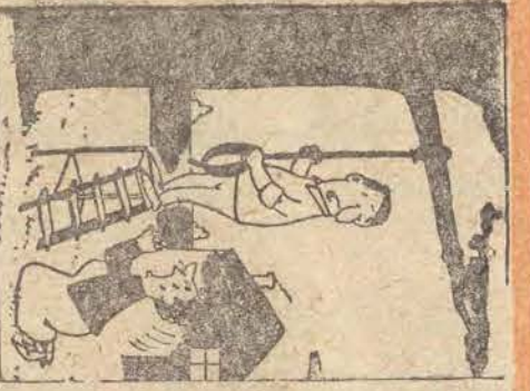
— Kto, nie ma kochanej kobiety... —