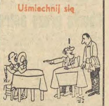
— Panie starszy, dla mnie to samo, co jadł ten gość...