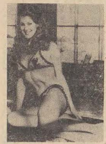
Tegoroczna „Królowa Śniegu” zimowego karnawału w Sullii...