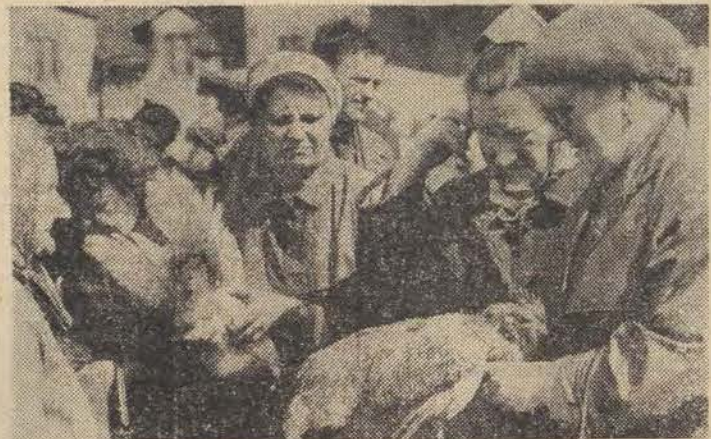
Migawka z Bałuckiego Rynku. — No to ile pani chce w końcu za tego kuraka?

Naczelnik ZHP wydał rozkaz specjalny, skierowany do wszystkich drużyn i szczepli, mających na celu popularyzację akcji „Najpiękniejsze kwiaty mojej Ojczyzny”. Łódzcy harcerze w ramach tej akcji przepracują tysiące godzin przy porządkowaniu i pielęgnacji terenów zielonych naszego miasta. I tak np. hufiec Poleśie zadziży ponad 30 tys. drzew i krzewów w swojej dzielnicy. Harcerze Widzewa podejmą pracę przy porządkowaniu amfiteatru i Sikawy. Harcerze Górnie już uczestniczą w sadzeniu lasu na Lublinku. (J. Kr.)