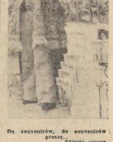
Do souvenarów, do souvenarów proszę...