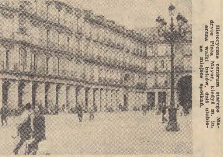
Historyczne centrum starego Madrytu. Plac Plaza Mayor, kiedyś m. in. arena walki byków, dziś ulubione miejsce spotkań.