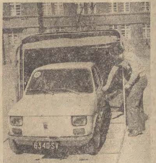
CAF — Jakubowski

Spółdzielnia Usług Wielobranżowych im F. Dzierżyńskiego w Gliwicach proponuje właścicielom „Fiatów 125” składany garaż typu namiotowego. Jego szkielec wykonano z rurek aluminiowych, a pokrycie z brezentu. Garaż jest łatwy w montażu, poza tym eureka i pokrycie można transportować w pokrowcu. Całość waży 24 kilogramy.