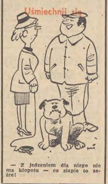
Uśmiechnij się — Z jedzeniem dla niego nie ma kłopotu — co złapie to zje!

użyć tapicerki siedzenia kierowcy. Nie pozabawione sensu są obserwacje odcienia lakieru oglądanej przy różnym natężeniu światła. Samochód po wypadku będzie miał co najmniej 2-3 elementy karoserii pomalowane innym lakierem. Najtrudniejszą do ustalenia sprawą jest zużycie silnika. W samochodach o pojemności od 1,5 litra tzw. pierwszy szlif cylindrów następuje po ok. 80-90 tys. kilometrów. Silnik zużyty dymi z otworu korka wlewu oleju, jest zanieczyszczony olejem, a z rury wdechowej wydobywa się charakterystyczny, niebieski dym. Nie należy sugerować się nadmiernym hałasem łańcucha rozządu, ale dla rozróżnienia dźwięku zużytego silnika trzeba już bardziej wprawnego ucha. Na zakończenie uwaga generalna: przed spisaniem umowy kupna-sprzedaży trzeba sprawdzić, czy numery nadwozia i silnika wybite na tabliczce najczęściej pod maską silnika zgadzają się z odnotowanymi w dokumentach. Jeśli dane na tabliczce są nieczytelne, numery odczytać można na blachach karoserii lub bloku silnika.