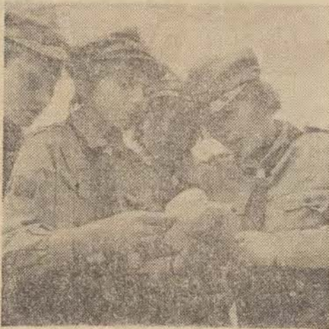
Dochód z niej przeznaczono na Centrum Zdrowia Dziecka. Z poszczególnych szkół samochodami udestępnionymi przez zakłady pracy zwozi się makulaturę do Centralnej Składnicy Surowców Włóchnych przy ul. Brukowej. (J. Kc.)

Wprawdzie X Alert ZHP pod hasłem „Nasz dom — Polska Ludowa” już się zakończył, ale w Łodzi poszeże gólnie drużyny ZHP przeprowadzają zbiórki makulatury, która była jednym z zadań alertowych.