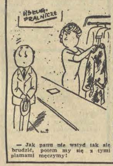
— Jak panu nie wstyd tak się brudzić, potem myć się z tymi płamami męczymy!