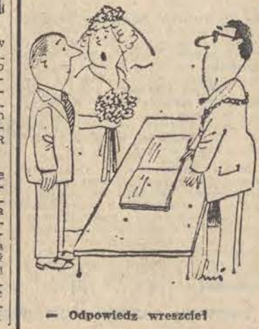
— Odpowiedz wreszcie!

Taka sobie myśl Medrzez nie zna słabości przebaczenia, bo nigdy się nie obraża. Uśmiechnij się