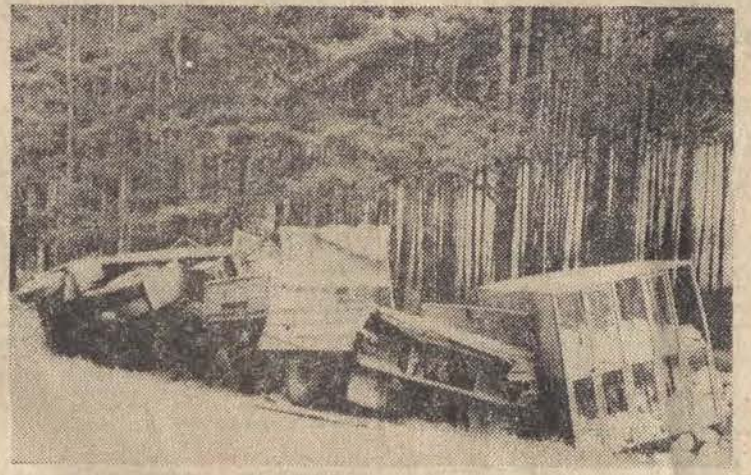
Na trasie wycieczki — składowiska w pobliżu wsi Trzebieszewo uległ rozbiću samochód ciężarowy wiozący kłaki z drobnem. Wóz wylądował w rowie, część kurczak zginęła, reszta uciekła z rozbitych kłatek. Na szczęście ofiar w ludziach nie było.

Niedaleko Lille (Francja) znaleziono olbrzymi grzyb, którego wysokość wynosiła 1 metr 20 centymetrów, a waga 5 kg. Grzyb pochodzący z gatunku „Lyperion bovista” nie należy do jadalnych.