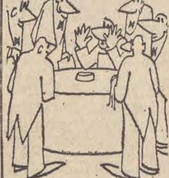
— Spokojnie panowie, proszę po kolei!