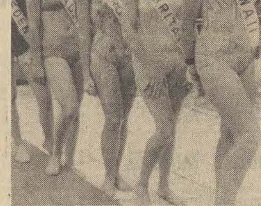
W Tokio odbywała się obecnie wybory Miss Młodszej. Oto 5 z 39 kandydatek do tego tytułu. Rozstrzygnięcie konkursu — 9 bm.

ników i wczasowiczów pytanie, udzielają odpowiedzi specjaliści z Instytutu Meteorologii i Gospodarki Wodnej. Otóż, ich zdaniem, sierpień br. będzie na ogół chłodny, ale opady deszczu — które tak nam dokuczyły w ostatnich miesiącach — utrzymają się poniżej normy. Przewiduje się, że średnia temperatura sierpnia wyniesie 17,4 st., a miesięczna suma opadów — 89 mm.