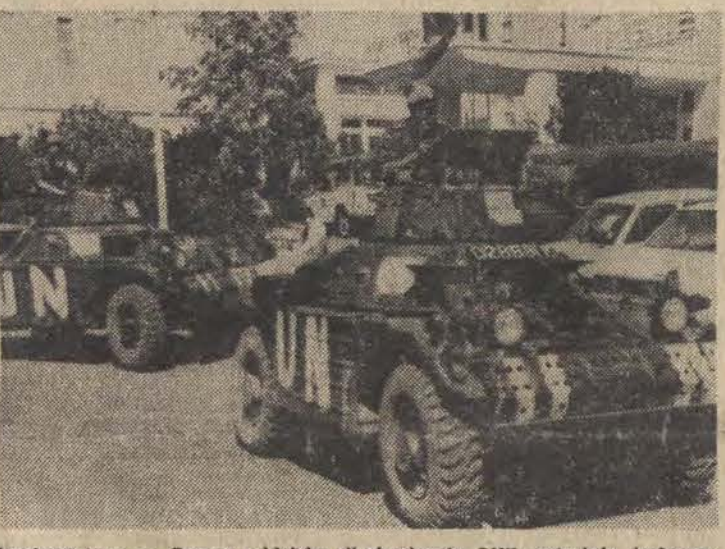
Przebywające na Cyprze oddziały sił zbrojnych ONZ patrolują buforową strefę bezpieczeństwa między obszarami zajętej przez armię turecką, a pozostałą częścią Cypru.

Jak informuje rzecznik prasowy rządu - 2 bm. odbyło się kolejne posiedzenie Prezydium Rządu, na którym rozpatrzone i uchwalone, zaakceptowane przez Biuro Polityczne KC PZPR, program społeczno-gospodarczego rozwoju miasta Krakowa i woj. krakowskiego do roku 1980.