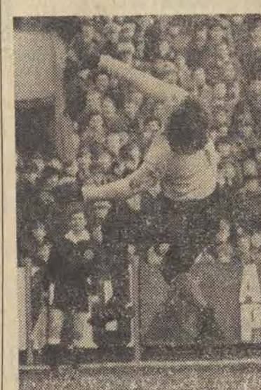
Tylko 1:1 w Warszawie