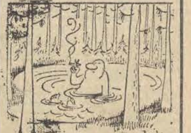
Chroń lasy przed pożarem!