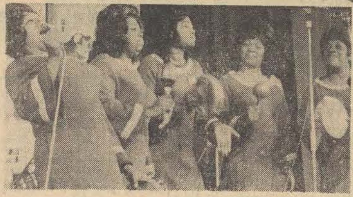
N/z: zespół „The Stars Of Talitha”

Obsługujemy zupełnie nowe zjawisko w muzyce rozrywkowej: stopniowe zanikanie granic między dotychczasowymi jej gatunkami i stylami. Nie ulega wątpliwości, że mamy tu do czynienia z nieodwracalnym procesem wchłaniania przez muzykę nie tylko mniej lub bardziej przejęsłowych stylów młodzieżowych, a także takich, które przez długie lata uważano za interesujące, lecz egzotyczne. Jako przykład może tu posłużyć jazz, który stał się niejako własnością światowej kultury muzycznej. Jazz i pop-music mają więcej cech wspólnych niż pozornie mogłoby się wydawać. Pop-music czerpie i z jazzu, i z gospel, i z soul, przy czym ten ostatni jest połączeniem twórczości czysto jazzowej z twórczością, której bezpośrednio wyrazem jest czysto jazzowy blues. Gdyby nie nowoczesny sposób aranżacji byłoby trudno odnaleźć granice między wykonaniem bluesa przez „Bluesbreakers”, Johna Nayalla, a wykonaniem tegoż bluesa przez Memphis Slima — jazzowego pianistę i śpiewaka bluesa. Nagrań Eddie Boyda z Fleetwood Mac, lub Sonny Boy Williamson z angielską grupą beatową The Yard Birds prawie niczym nie różniąc się od jazzowych, chicagowskich nagrań bluesowych.