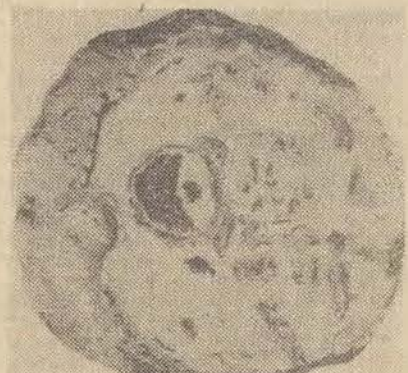
Komórka rakowa różniła się nieregularnie...

żeglugi w kontaktach międzyzadanych. Równocześnie misja spełnia rolę łącznika dla Polski z międzynarodową komisją rybołówstwa na północno-wschodnim Atlantyku i międzynarodowa doradczą organizacją morską (IMCO). Polska aktywnie uczestniczy w pracach IMCO, a szef polskiej misji morskiej jest już przez drugą kadencję wiceprzewodniczącym rady tej organizacji. Wreszcie polski sklep „Polonez”, który w Londynie pro-