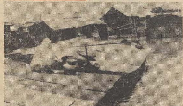
N.z: zalane wodą przedmieście Dhaki.

Sytuacja powodziowa w Bangladeszu uległa w ciągu ostatnich 24 godzin dalszemu pogorszeniu.