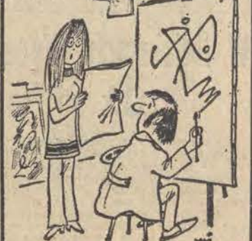
— Jakże Botticelli dostał podobno pięć milionów dolarów za obraz. Dlaczego ty tego nie potrafisz?