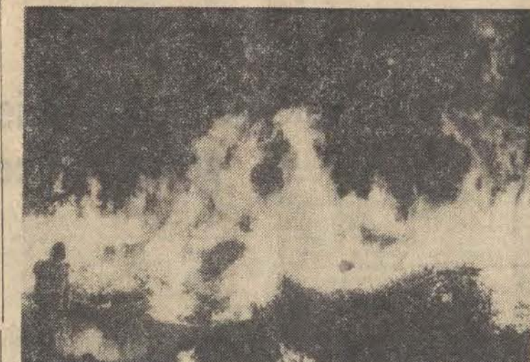
Na zdjęciu: płonące poszycie lasne.

Dopiero w czwartek 1200 strażaków oraz cała eskadra specjalnych samolotów opanowała szalony od wiatru w pobliżu Los Angeles pożar lasu. Pastwa płomieni paliła 10 tys. akarów lasu. Walczącym z pożarem strażakom w ostatniej chwili udało się ewakuować około tysiąca osób.