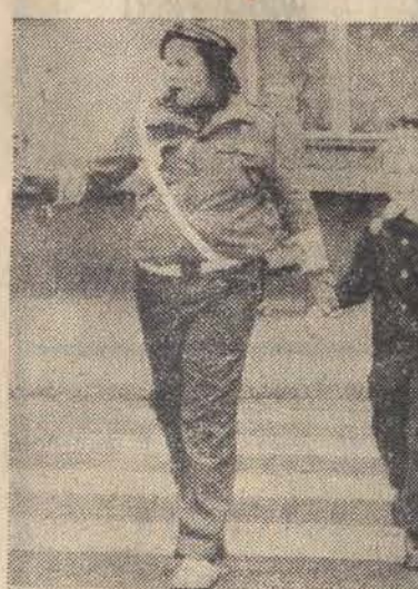
Pod hasłem „Uwaga, dziecko na drodze!” odbyła się wczoraj w całym kraju, wielka akcja Komendy Głównej MO i Polskiego Radia. Od godz. 6 do 18, milicjanci, społeczni inspektorzy ORMO i harcerze z MSR, pełnili służbę w pobliżu szkół, przeprowadzali najmożliwszych przez jezdnię, wyjaśniali zasady ruchu drogowego. Takich obrazków, jak ten na zdjęciu, można było zaobserwować wiele. (L.C.)