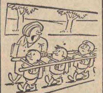
Pierwsza lekcja chodzenia w czasie akcji — Stop! Dziecko na drodze!