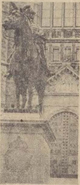
Sam sprawca „potopu” — Karol X Gustaw.