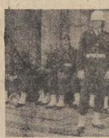
Poderwała się wkrótce odpoczywająca pod murkiem straż...