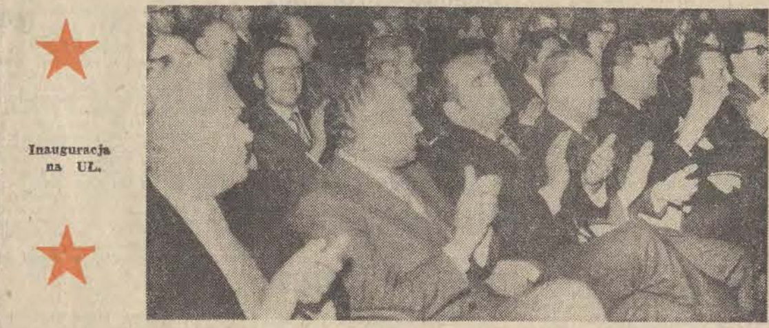
Inauguracja na UL.