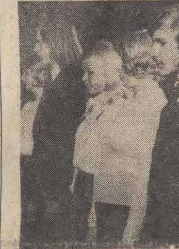
Moment przyrzeczenia na UL.

stwa silne, dobrze gospodarujące, przynoszące zyski obu stronom. Gorącymi oklaskami dziękują zebrani dziennikarze polskiemu premierowi za jego udział w spotkaniu.