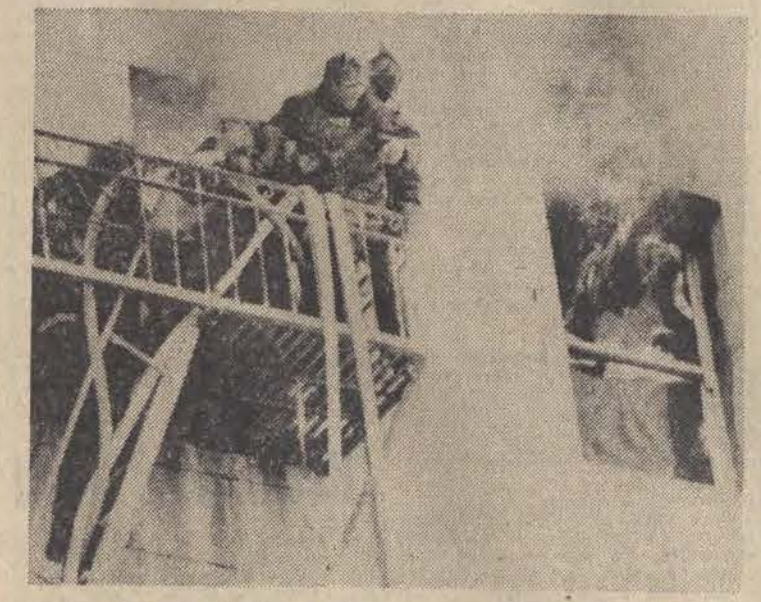
14 bm. w hotelu „Grand Central” w San Francisco wybuchł pożar, w którym zginęła 1 osoba. Ekipy straży pożarnej ewakuowały mieszkańców hotelu, ale nie zdołaly uratować gościa pokoju — miejsca wybuchu pożaru.