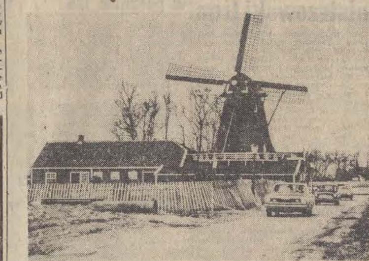
...nieodłączny element krajobrazu w tym kraju, nie są wyłącznie relikwiami przeszłości. Praktyczni Holendrzy konserwują je i nieodłącznie i wciąż używają jako tanie źródło energii.