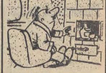
— To jest twój telewizor!