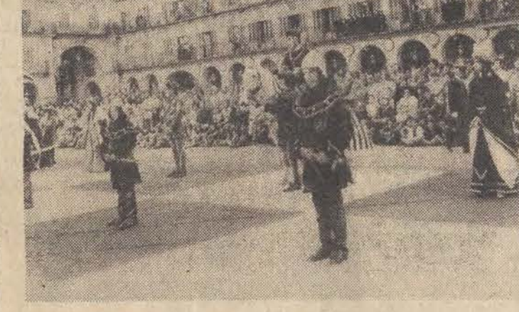
Mecz szachowy rozegrany we wspaniałej scenerii Plaza Mayor w hiszpańskiej Salamance cieszył się ogromną popularnością. O rolę „żywych figur szachowych” ubiegali się o znakomitsze osobistości miasta.