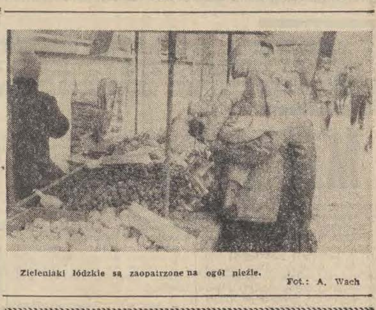
Zielonki łódzkie są zaopatrzone na ogół pięćle.

Dla bywalców i dla każdego Tydzień w „Uniwersalu” — towary z NRD za 18 milionów złotych Nawet bywalec z „Polityki”, który niedawno miał trudności ze zdobyciem w Warszawie kija do szczytki, w Łodzi znalazłby pełną satysfakcję. 28 października w „Uniwersalu” zaczyna się kolejny „Tydzień sprzedaży artykułów z NRD”.