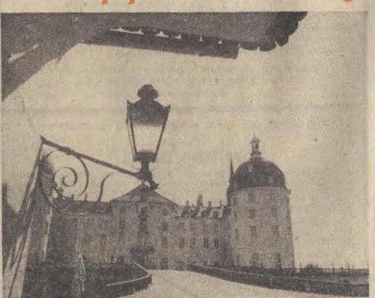
Barokowy pałac w Moritzburgu koło Drezna.