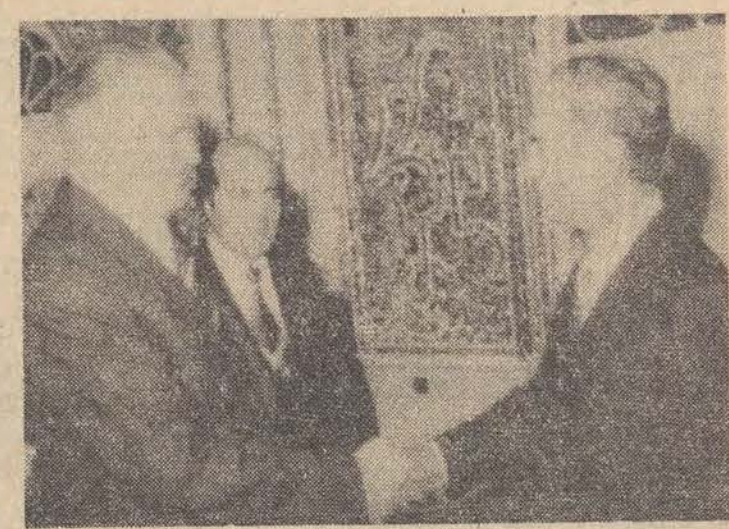
13 bm. przebywający z wizytą w Iranie premier PRL Piotr Jaroszewicz został przyjęty przez cesarza Iranu Reza Pahlavi.

13 bm. prezes Rady Ministrów PRL, Piotr Jaroszewicz, został przyjęty przez cesarza Iranu Mohammada Reza Pahlavi. W toku dłuższej rozmowy omówiono węzłowe problemy dalszego rozwoju stosunków polsko-irańskich, a także dokonano wymiany poglądów na zagadnienia międzynarodowe, będące przedmiotem wspólnego zainteresowania.