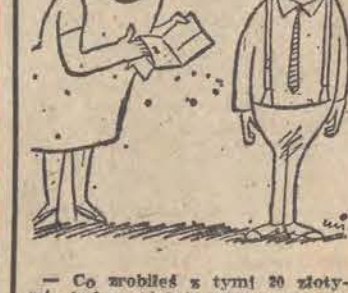
— Co zrobiłeś z tymi 20 złotymi, które miałeś ukryte w „zaskórniku”?