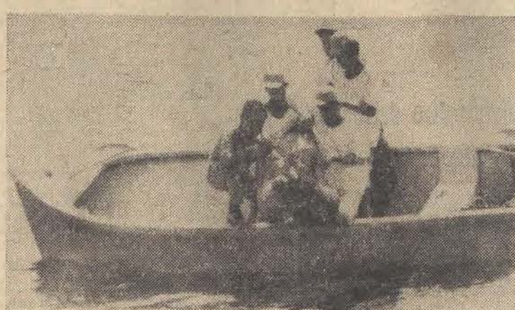
U wybrzeży Tajlandu wydobyto z dna morza naczynia porcelanowe sprzed 7 wieków — z okresu powstania państwa Thai.