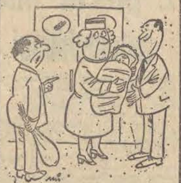
— Bardzo przepraszam, sestro, ja tu byłem przed tym panem!