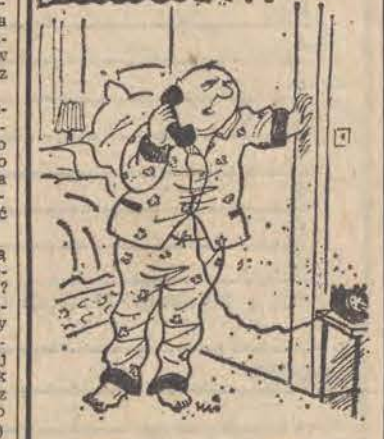
— Szkoda, że to pomyłka. Ale skoro już się obudziłem, to chętnie bym trochę porozmawiał!...