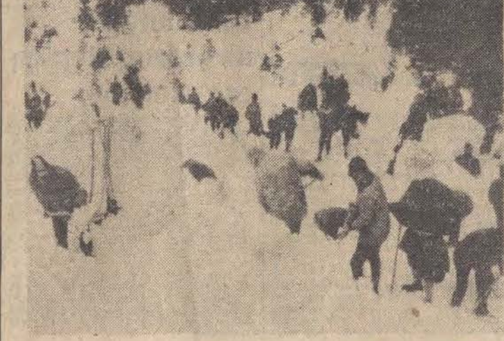
W Mittenwald w Alpach bawarskich lawina zasypała 8 bm. dwóch 17-letnich chłopców. Ekipy ratownicze przystąpiły natychmiast do poszukiwań.