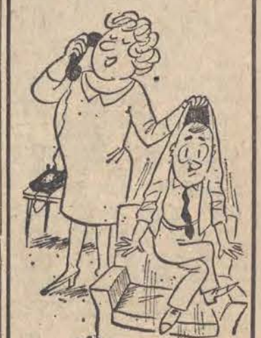
— Chwileczkę, już go panu dale!