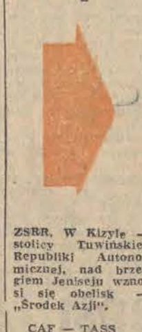
ZSRR, w Kizyl — stolicy Tuwńskiej Republiki Autonomicznej, nad brzegiem Jeniseju wznosi się obelisk „Środek Azji”.