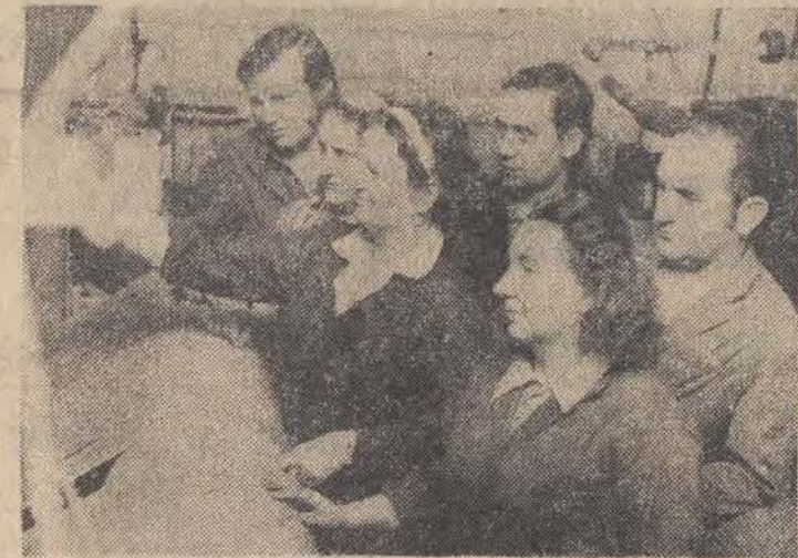
Najlepsi pracownicy zakładu G ZPW im. P. Bardowskiego.

Jeszcze 16 dni roboczych dzieli nas od końca roku kalendarzowego. A jednak już teraz zalogi łódzkie zakładów pracy miedlą o wykonaniu tegorocznych planów produkcyjnych. Wśród pierwszych na finiszu znalazły się Zakłady Przemysłu Włnianego im. P. Bardowskiego.