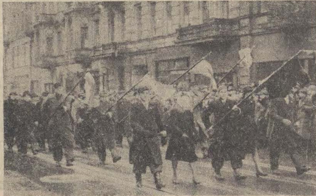
Na zdjęciu fragment pierwszej defilady mieszkańców wyzwolonej Łodzi. Może ktoś z Czytelników rozpozna się, lub swoich bliskich czy

znajomych, na tym archiwalnym zdjęciu sprzed trzydziestu lat.