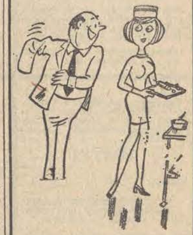
— Robi słowa zastrzyki w domu?