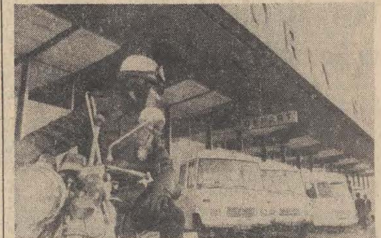
Ambulanse na paryskim lotnisku Orly oczekujące na uwolnienie zakładników przez terrorystów palestyńskich. Zamach na startujący do Tel Awiwu samolot izraelskich sił lotniczych „EL AL” miał miejsce 19 bm. po południu.

Zródłem tego przekonania jest fakt, iż przed zakończone obecnie przerwy, we wszystkich punktach porządku obrad KBWE został osiągnięty istotny postęp, który zarysował