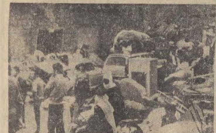
Ponad trzy tysiące mieszkańców granicznego miasteczka libańskiego Kfar Choub, została zmuszonych do ewakuacji na skutek ciągłych ataków artylerii izraelskiej.

Jak wynika z ostatnich informacji nadechodzących do Delhi, w wyniku trzęsienia ziemi, które w niedziele nawiedziło stan Himacjal Pradesh, 150 km na północ od stolicy,