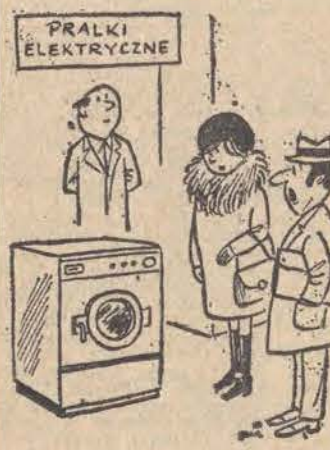
— Po co? Przecież mama jest... doskonale sobie daje radę!..