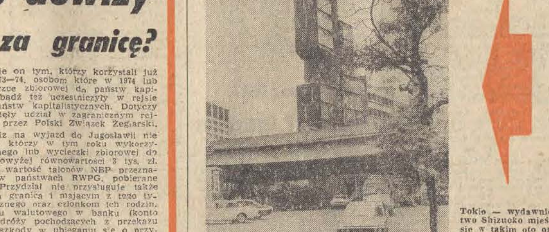
Tokio — wydawnictwo Shizuoka miejsce w takim oto oryginalnym budynku.