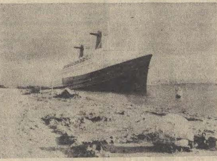
„France” — jeden z najbardziej ekskluzywnych statków pasażerskich na świecie, który stał się ofiarą podwyżki cen ropy naftowej, stał zapomniany w najdalszej części portu w Hawrze.