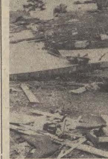
24 bm. nad miejscowością Douglasville (Georgia USA) przeszło potężne tornado niszcząc wiele domów.

Według oficjalnego komunikatu opublikowanego wczoraj w Atenach przez Ministerstwo Obrony Grecji, władze aresztowały 37 oficerów zamieszanych w nieudany zamach stanu.