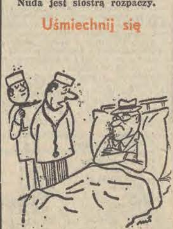
— Niech pan nie będzie taki niecierpliwy — pański pobyt w szpitalu potrwa trochę dłużej niż pan przypuszcza.