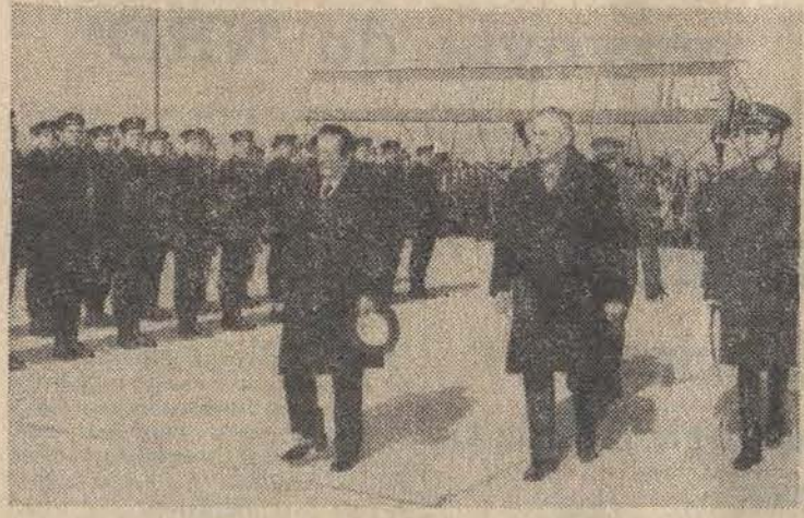
N/Z: przed frontem kompanii honorowej w Rzeszowie.

10 km, na zaproszenie I sekretarza KC PZPR Edwarda Gierka przybył do Polski w przyjacielską wizytę prezydent Socjalistycznej Federacyjnej Republiki Jugosławii, przewodniczący Związku Komunistów Jugosławii — Josip Broz Tito z małżonką.