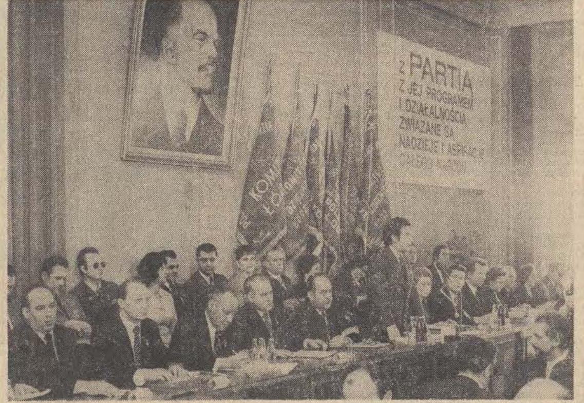
Na zdjęciu: moment otwarcia obrad XVIII Łódzkiej Konferencji Sprawozdawczo-Wyborczej.