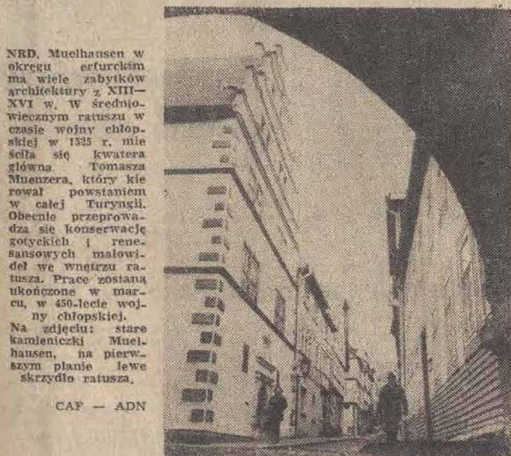
NRD. Muelhausen w okręgu Erturcim ma wiele zabytków architektury z XIII-XVI w. W średnio-wiecznym ratuszu w czasie wojny chłop-skiej w 1325 r. mie-sciła się kwatera główna Tomasza Muenzera, który kierował powstaniem w całej Turyni. Obecnie przeprowadza się konserwację gotyckich i rene-sansowych malowideł we wnętrzu ratusza. Prace zostaną ukończone w marcu, w 450-lecie wojny chłopskiej. Na zdjęciu: stare kamieniczki Muelhausen, na pierwszym planie lewe skrzydło ratusza.