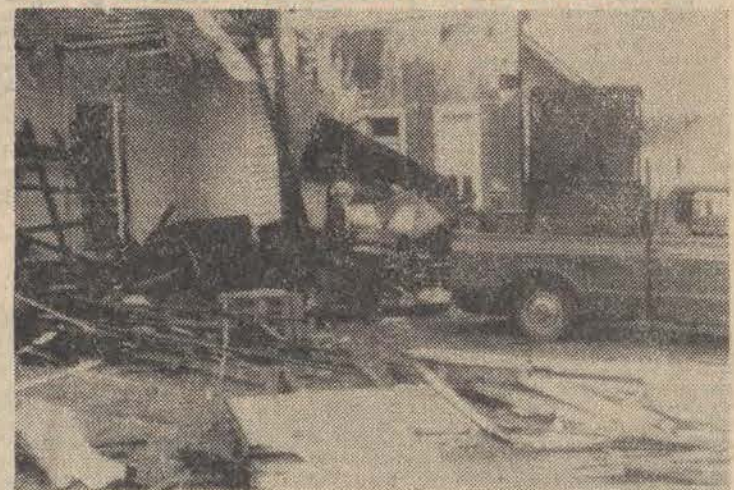
29 km. nad miastem Warren w stanie Arkansas przeszło tornado, które zniszczyło wiele budynków, 6 osób zginęło, kilkadziesiąt zostało rannych.