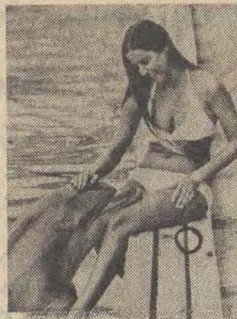
Uśmiech dla delfina...

Muzeum Sztuki w Łodzi opracowuje obecnie pełny katalog dzieł Władysława Strzemińskiego. Niemala tych prac znajduje się obecnie w zbiorach tego muzeum. Jednak wiele innych pozostaje w rękach nieznanymi właścicielami. Dlatego też za pośrednictwem naszej redakcji muzeum prosi osoby, posiadające obrazy Strzemińskiego, o udzielenie informacji pod adresem: Muzeum Sztuki w Łodzi, Łódź, ul. Wieńcowskiego 36, tel. 397-90 i 289-75 - Dział Sztuki Nowoczesnej. M.