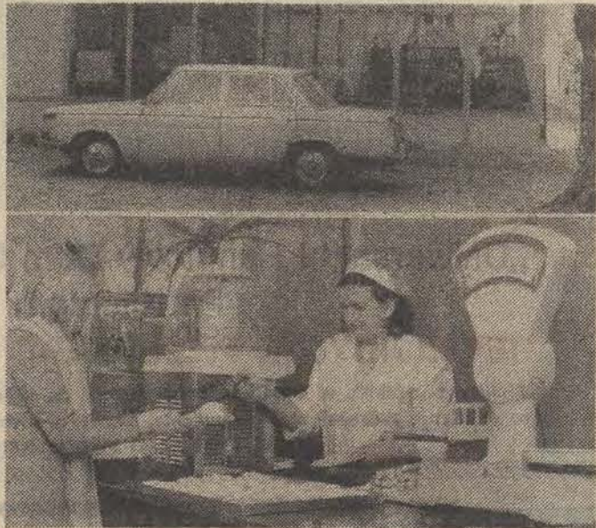
Przybywa nam pawilonów gastronomicznych typu „Gizycka”. Ostatnio otwarta została tego rodzaju placówka przy ul. Gdańskiej 99...