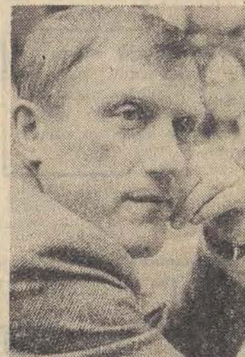
Mam przed sobą kilka kartek zapisanych drobnym makiem. Zaangażowanie, samookreślenie ideowe, szczerze wypowiedzi, te słowa powtarzają się wielokrotnie...