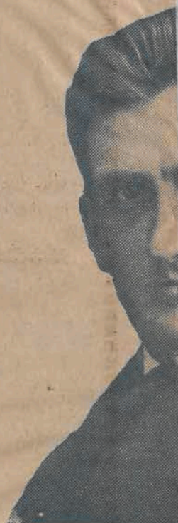
Dyrektor Te p. Józe