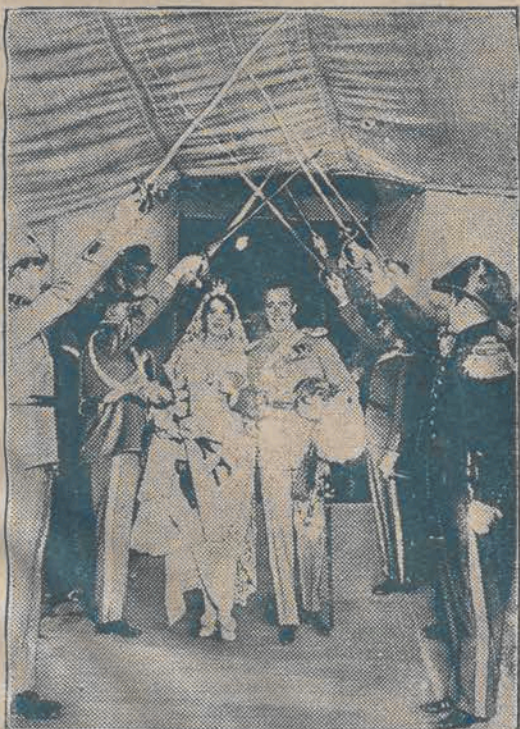
Książę Bernandotte ze swoją narzeczoną córką milionera amerykańskiego.