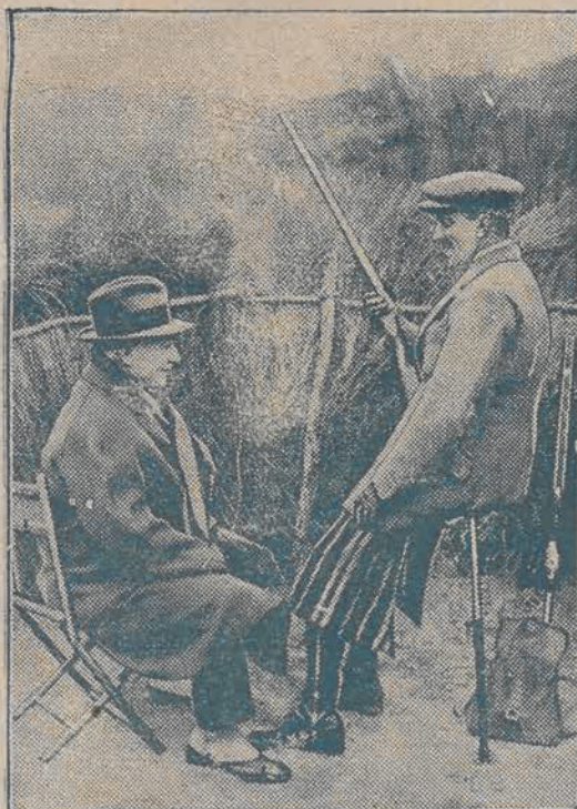
Król hiszpański Alfons XIII i generał Primo de Rivera w oczekiwaniu na zwierza.