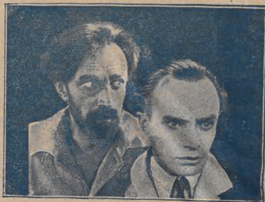
Conrad Veidt w filmie „Mężczyzna z przeszłością” pod dwoma postaciami.