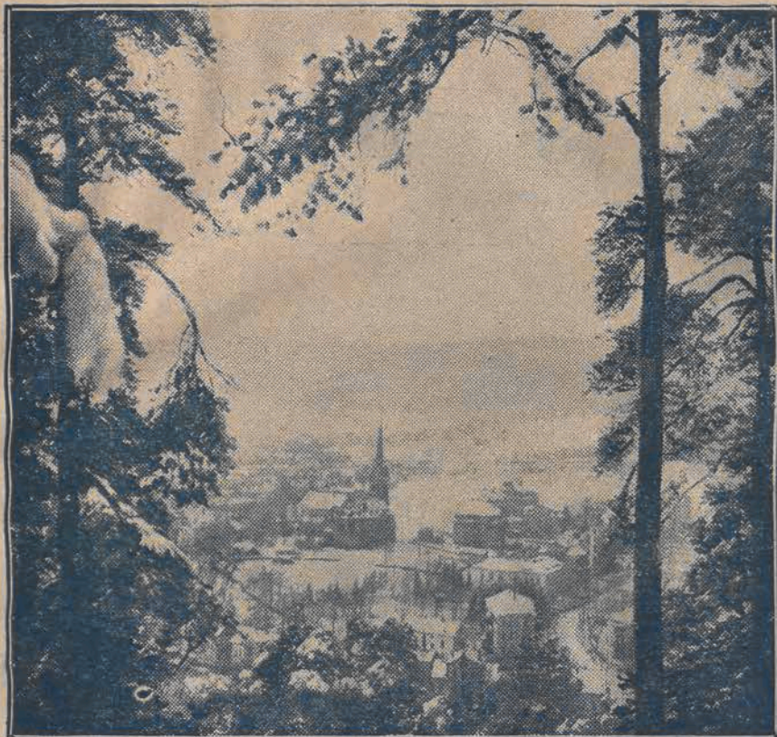
Miasto pokryte śniegami, w lodowych okowach mrozu ostatnich dni, widziane z lotu ptaka.