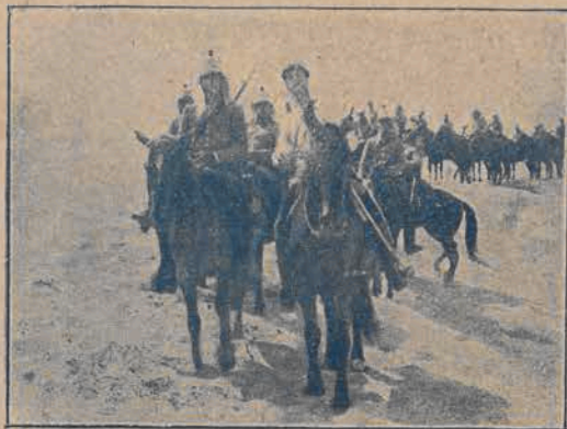
Scena z filmu „Mężczyzna z przeszłością” wyświetlanego obecnie w kino-teatrze Resursa.