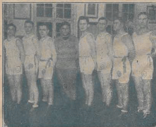
Drużynowy mistrz bokszerski Polski Klubu Sportowego „Warta”.