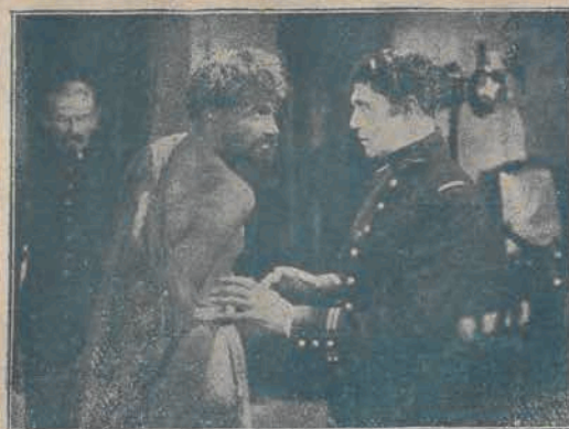
„Mężczyzna z przeszłością” Conrad Veidt w swej znakomitej kreacji D-ra Pawła la Roche zesłania na wyspę Mont Noir. Film ten wyświetla kino-teatr „Resursa”.