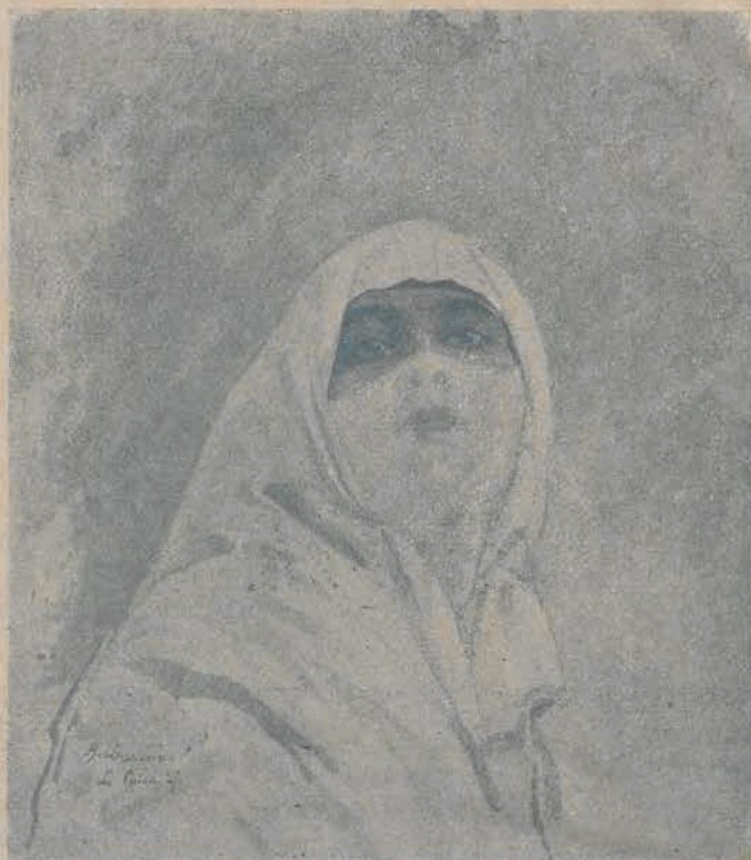
Reprodukcja obrazu Aleksandra Laszenki, którego prace są obecnie wystawione w Miejskiej Galerji Sztuki.