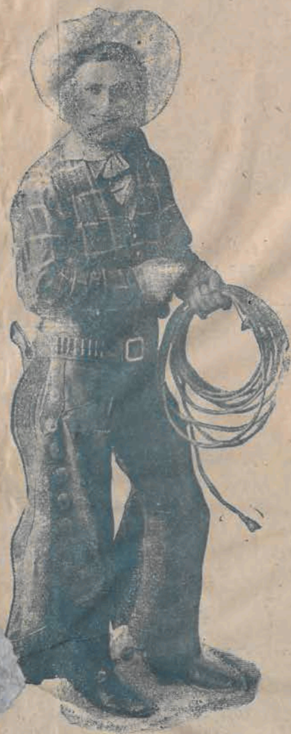
— Tom Mix wraz ze swym ognistym rumakiem „Tonny” występuje w świątecznym programie w kino-teatrze „Czary”.