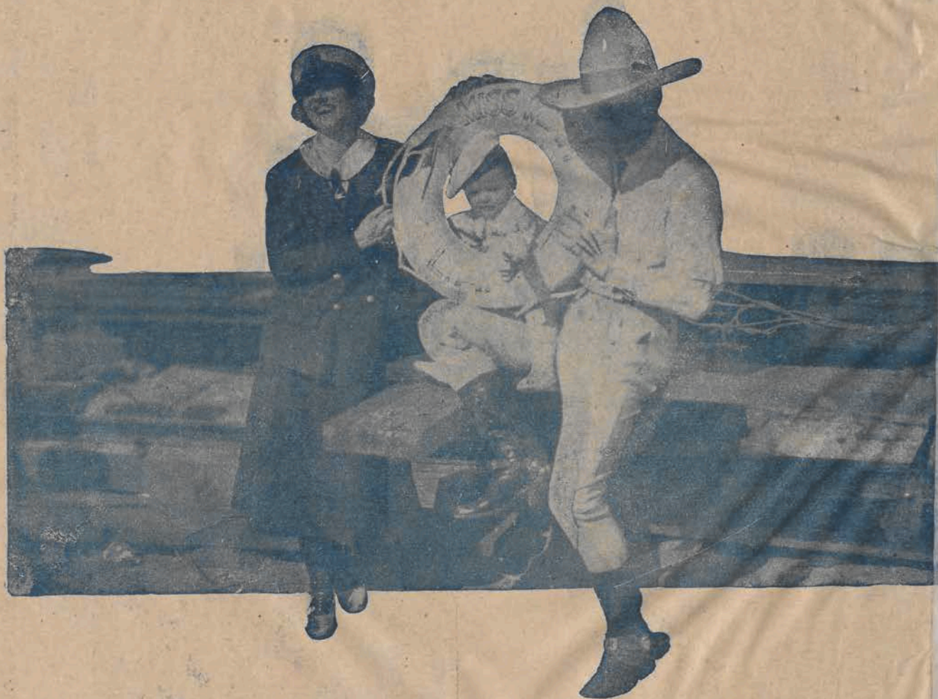
Znany cowboy Tom Mix ulubieniec młodzieży w ostatnim swym filmie na ekranie „Czarów”.