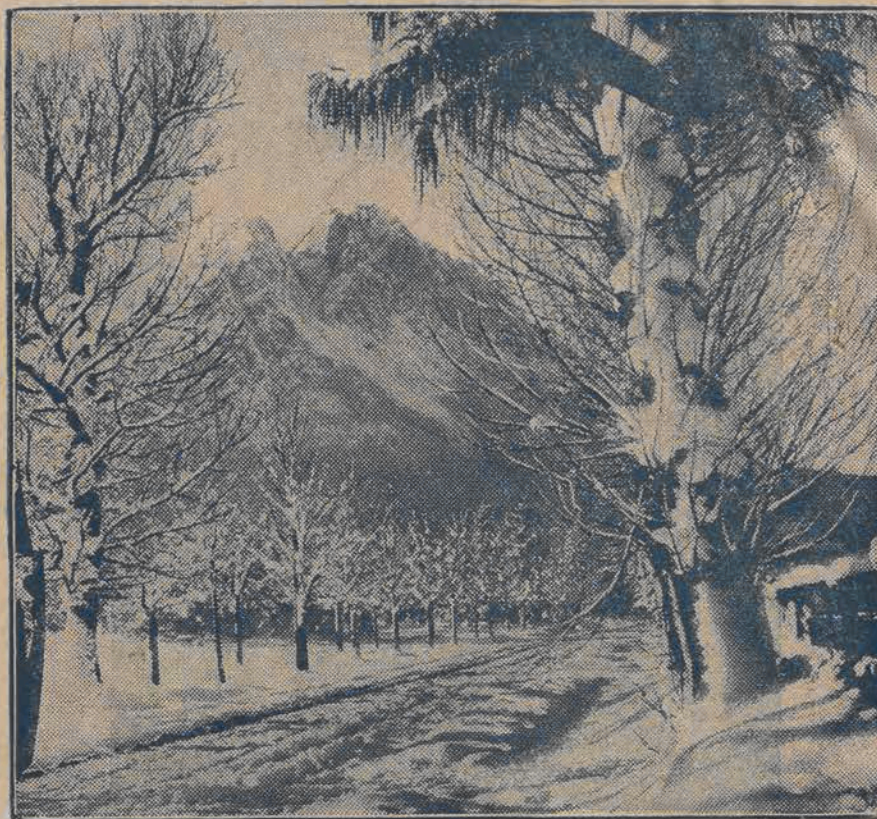
Przepiękny widok Tatr w zimowej szacie.