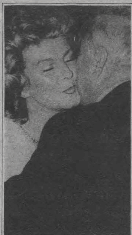
Tak całują prezesi!