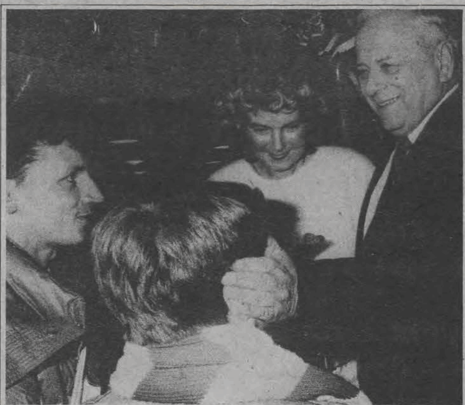
Z gratulacjami pospieszyli też licznie obecni na uroczystości w widzewskim USC kibice: nie mogło zabraknąć i „szalikowców”, czyli najmłodszych, tych, którzy mecze oglądają z trybuny pod zegarem.