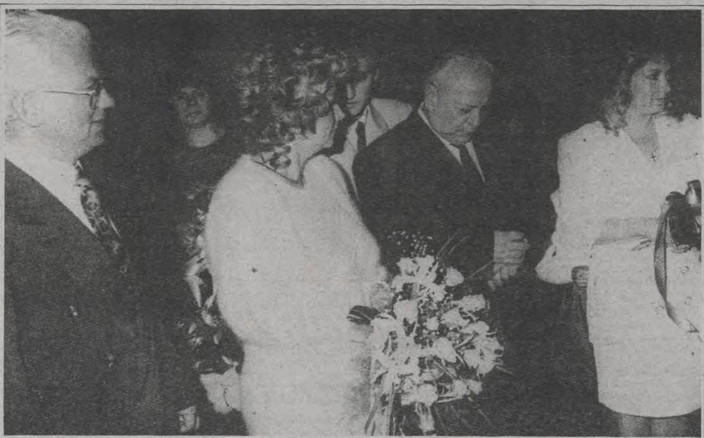
„Uroczystość uroczystością, ale czasu za dużo nie ma – moi chłopcy grają za trzy kwadransy mecz z wiceliderem ekstraklasy!” – zda się mówić pan młody, nerwowo spoglądając na zegarek...