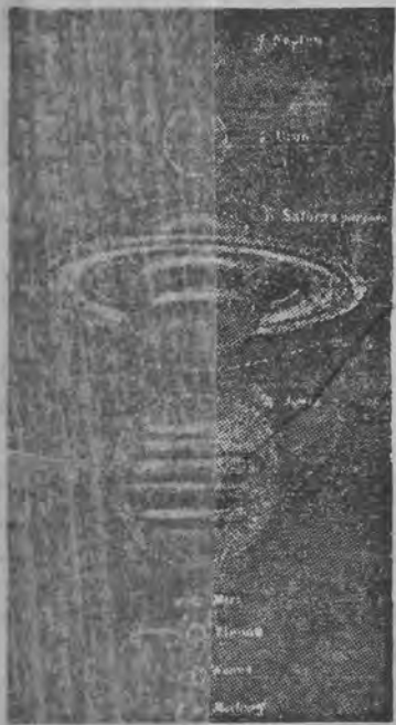
PLANETY I ICH WIELKOŚĆ W STOSUNKU DO ZIEMI.

Nie tak dawno jeszcze wolano o fantazjach na temat życia mieszkańców Marsa i Księżyca. Wiedza współczesna dotychczas nie potwierdziła tych fantazji.