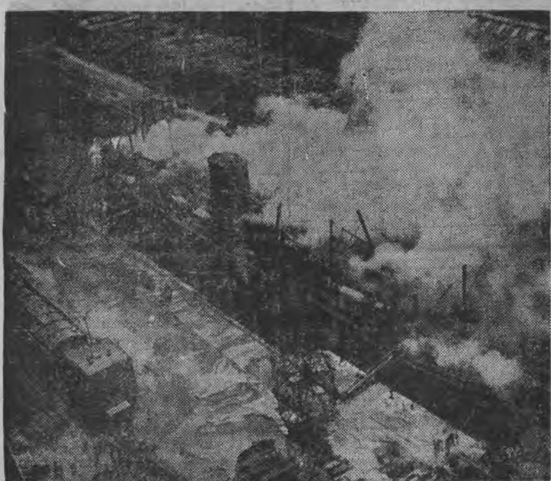
PAROWIEC TRANSATLANTYCKI „LA FAYETTE” W PŁOMIENIACH