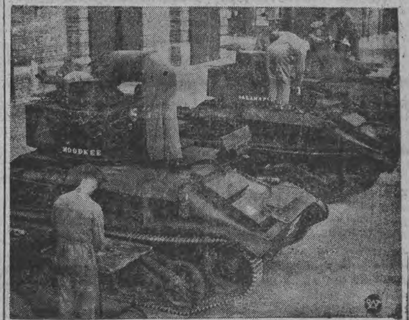
NOWE BATERIE CZOLGÓW, /