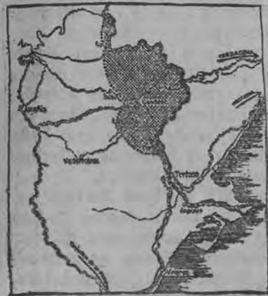
MAPA TERENU WALK. TERENY ZAKRESKOWANE, ZOSTAŁY ZDOBYTE PRZEZ WOJSKA REPUBLIKANSKIE W WYNIKU OFENSYWY.

Premier Negrin o bohaterskiej walce Hiszpanii Ludowej z najazdem faszystów